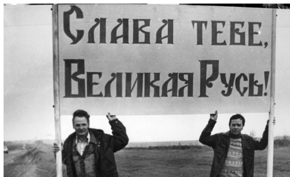
В. Крутин и В. Распутин на Куликовом поле

Как для питья Валентин Распутин выбирал чистейшую воду, байкальскую, так в речи предпочитал слово русское, сохранял его девственную чистоту и страдал от загрязнения родной речи не менее, чем от загрязнения воды в реках и озёрах. Да и слова «река» и «речь», конечно же, одного корня, родились от одной славянской праматери. Писатель видел, как сплошным потоком вероломно вторгаются в русский язык англицизмы и подменяют собой слова, взлелеянные пращурами, рождённые самой природой нашей Руси. Вода и речь — это бесценный дар предков, к нему нужно относиться бережно и защищать от всего наносного, что и делал всю жизнь Валентин Григорьевич. И тогда Россия будет процветать.