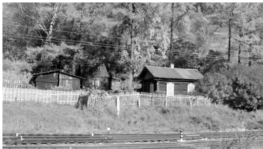
Дача В.Г. Распутина